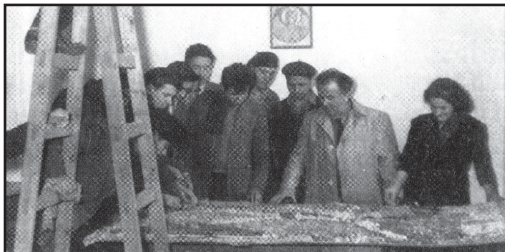
Професорѝ Личеноски со ученициѝе